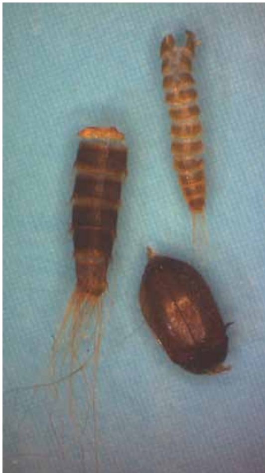
Brauner Pelzkäfer: Käfer und Larvenhäutungen

Die Entwicklung vom Ei bis zum Käfer vollzieht sich in einem Zeitraum von 6 bis 18 Monaten. In dieser Zeit häuten sich die Larven mehrmals, meiden das Licht und leben daher sehr versteckt. Die erwachsenen Käfer hingegen orientieren sich zum Licht hin. Sie können gut fliegen und sind daher häufig an Fenstern oder Fensterbänken zu finden.