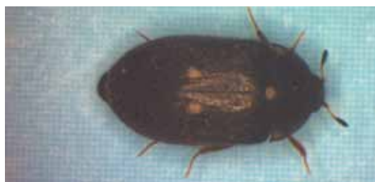
Gemeiner Pelzkäfer