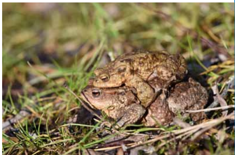
Erdkröten wandern im Frühjahr zu den Laichgewässern. Hier bringt ein Weibchen gleich das kleinere Männchen auf dem Rücken mit.