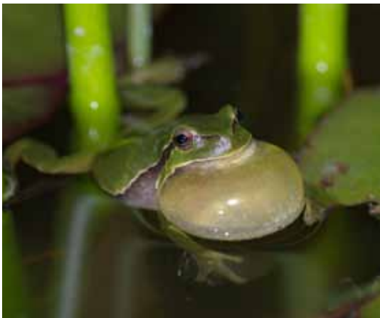
Der markante Ruf des Laubfroschs ist heute nur noch in wenigen Gebieten wie dem Rheindelta zu hören.