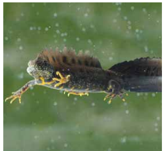
Der europaweit geschützte Kammmolch ist eine Besonderheit der Rheintalebene mit einem Schwerpunkt im Rheindelta.