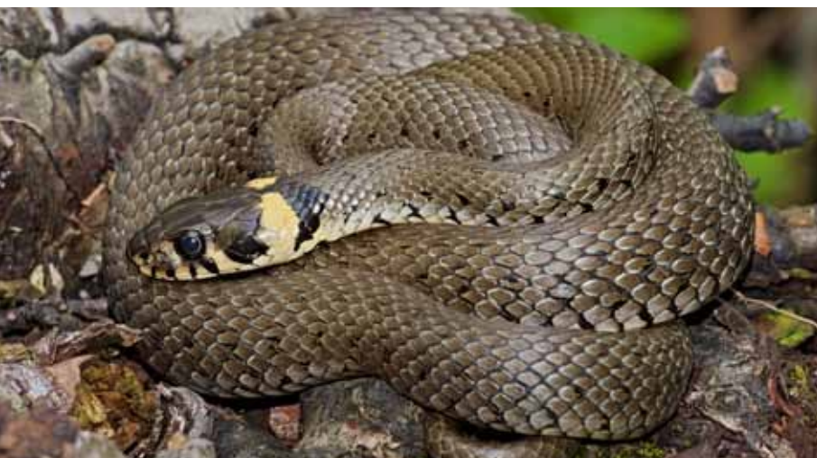
Die harmlose Ringelnatter ist gut an den gelben halbmondförmigen Flecken auf dem Hinterkopf zu erkennen.

Um den Bestand und die Gefährdungssituation der einzelnen Arten zu bewerten, hat die inatura 2003 umfangreiche Vorarbeiten für die Erstellung einer Roten Liste zur Her-