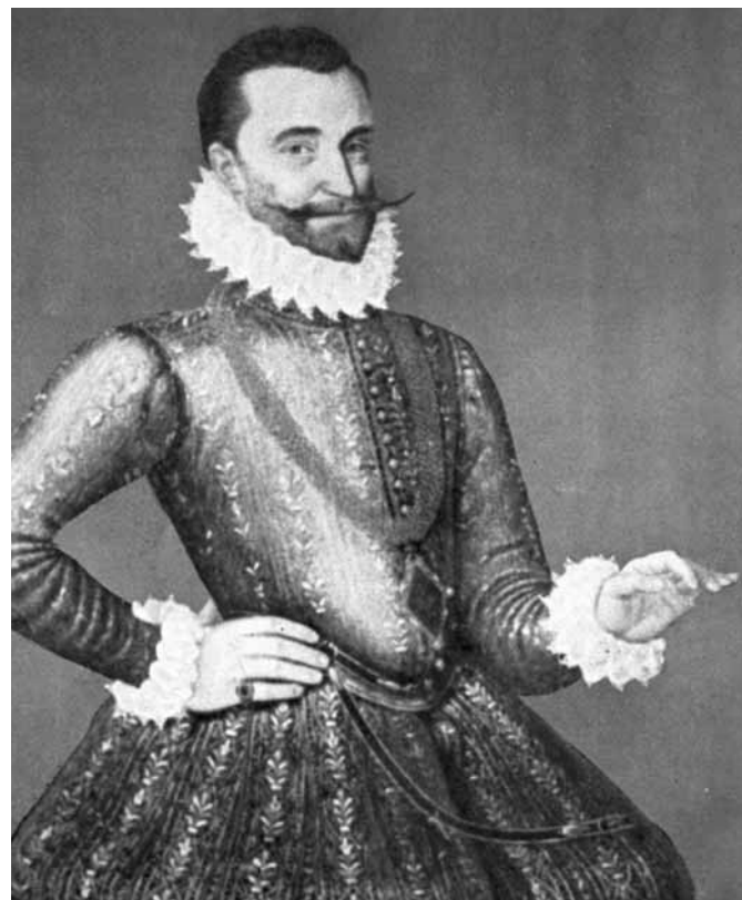
Graf Jakob Hannibal I. von Hohenems

Insgesamt hatten die Lustenauer sicher über lange Jahrhunderte das schwerere Leben. Sie mussten immer mehr Sumpfundgründe zum Anbau kultivieren und oft waren ihre Bemühungen umsonst, wenn der hochgehende Rhein alles zerstörte. Schon seit dem Spätmittelalter lag Lustenau an der Straße Feldkirch-Fussach, auf der es sichtlich viele Durchmärsche gab. Bei Brandschatzungen gab es kaum Holz zum Wiederaufbau.