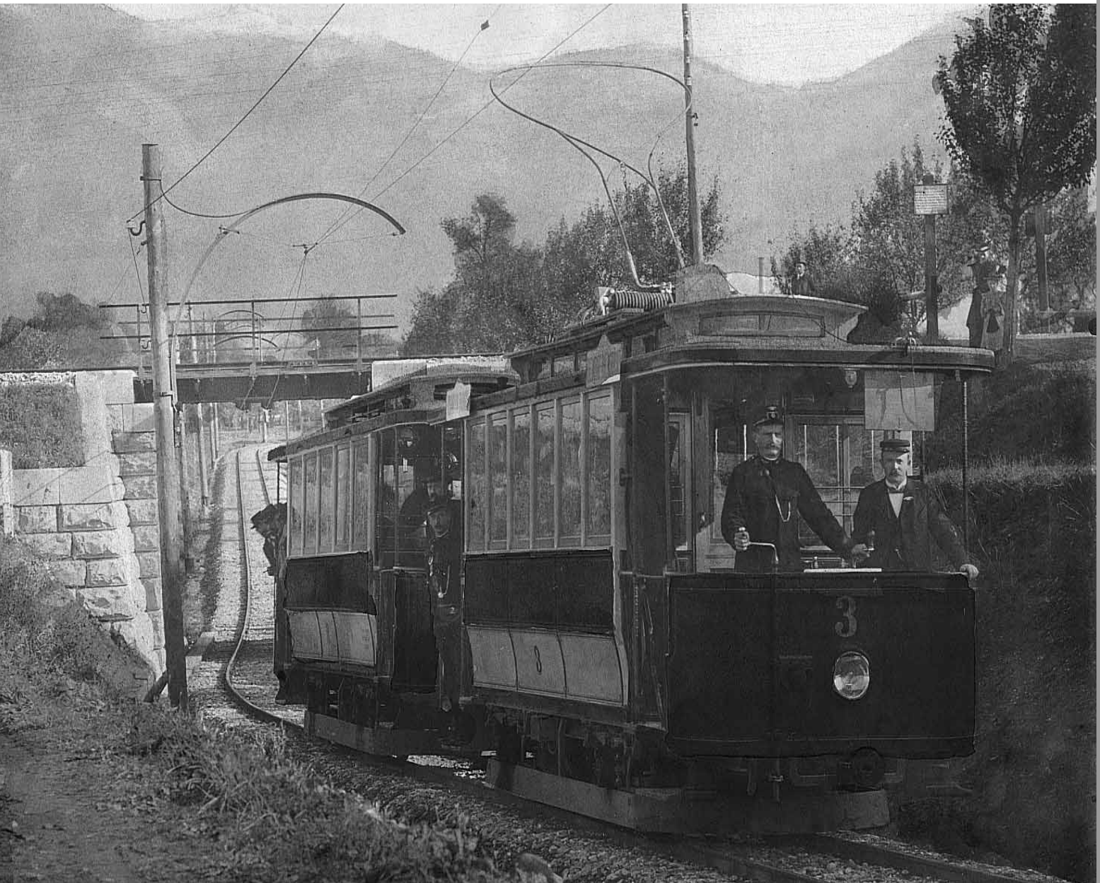
Elektrische Bahn Dornbirn-Lustenau

Mit und für Senioren gestaltete Zeitung der Stadt Dornbirn März 2008 / Nr. 54