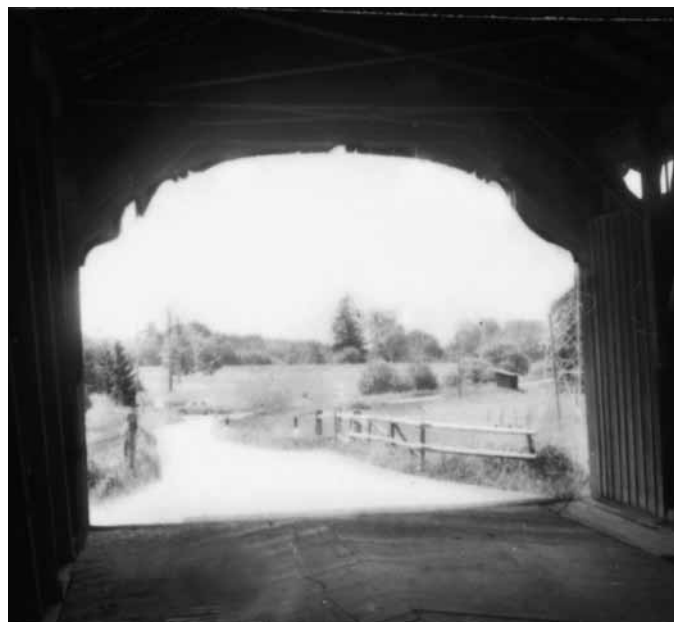
Die „Hechenfurt“ oder Hohenfurt war seit alters eine Grenze. Heute wird die Dornbirner Ache überbrückt