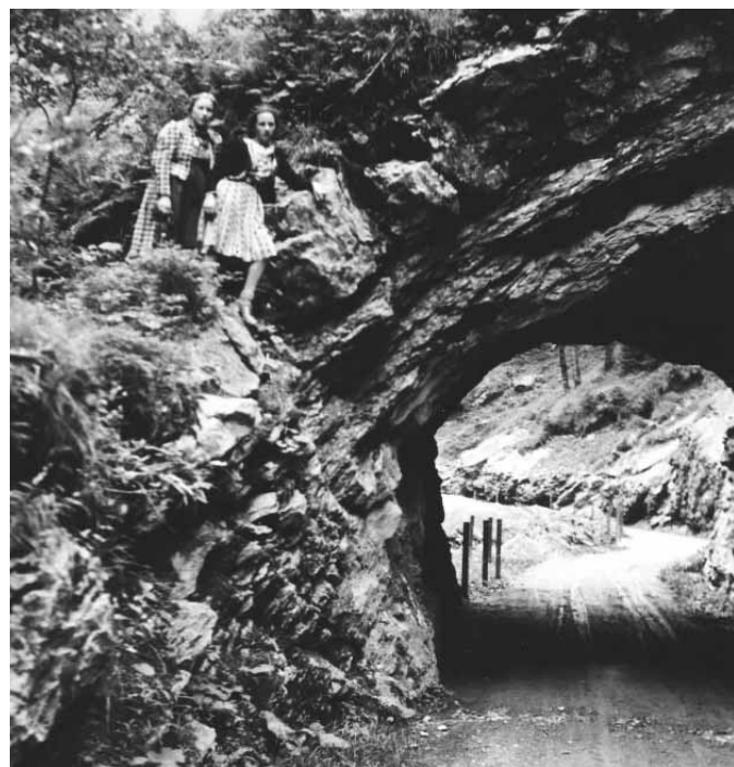
Tunnel bei der alten Bödelestraße